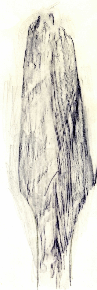
spets i nat. storlek